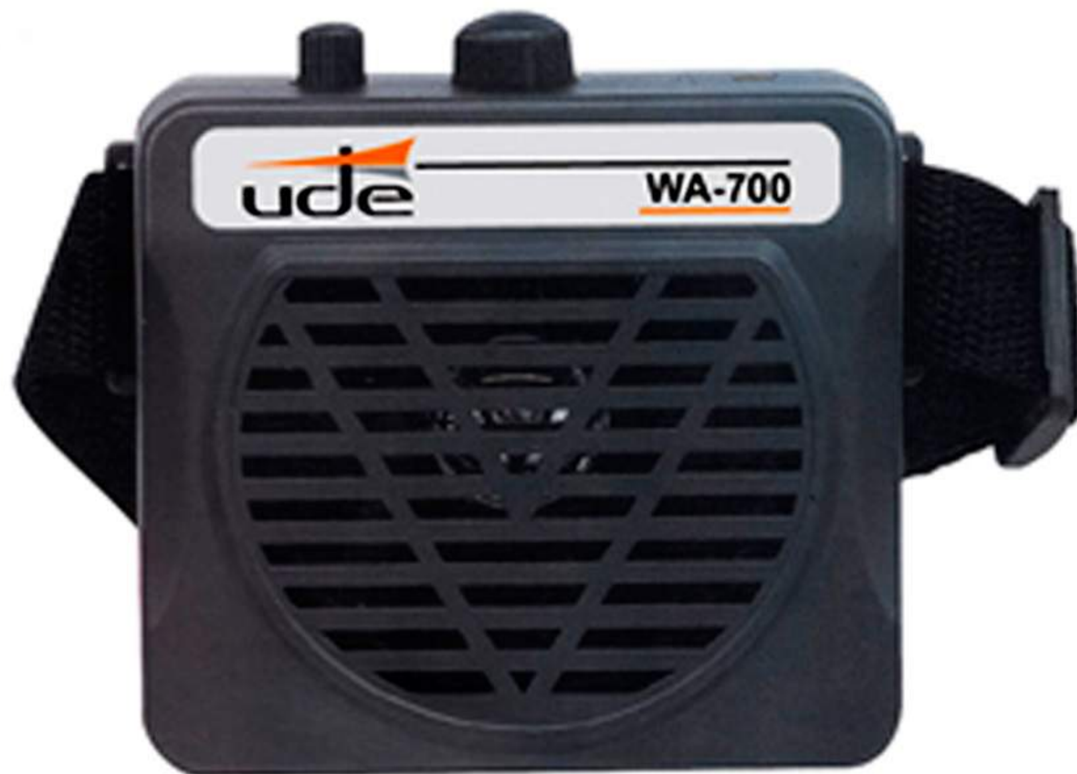
Sujeción en BANDOLERA